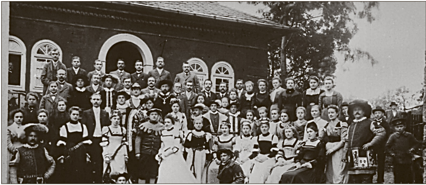
Damit fing alles an: Am 6. September 1902 wurde erstmals die Liebenbachsage als Theaterstück aufgeführt – anlässlich der Einweihung des Liebenbachbrunnens. Damit wurde der Grundstein für den Chorverein Liederkrantz Spangenberg gelegt.

• Kontakt: Herbert Bauch, Tel. 05661 / 66 54