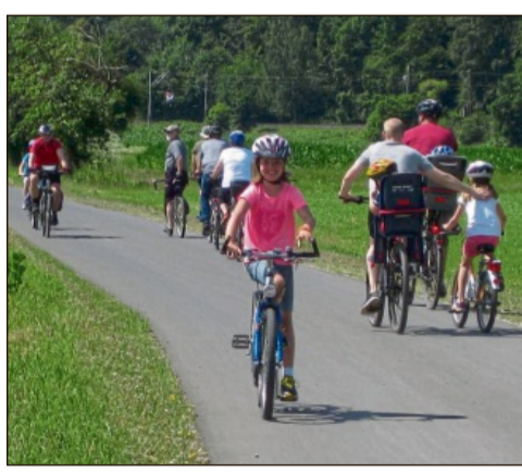
Leicht zu bewältigen: Die Strecke ist auch für Kinder gut geeignet.

Wer auf der Strecke mindestens fünf Stationen angefahren und abgestempelt hat, kann an einer Verlosung teilnehmen. Die Preise werden in